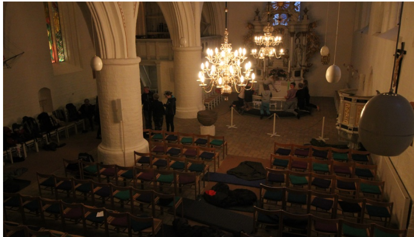
Et andet sted står en gruppe og er ved at blive interviewet af en journalist fra Flensborg avis, som havde fået nys om vores tur.