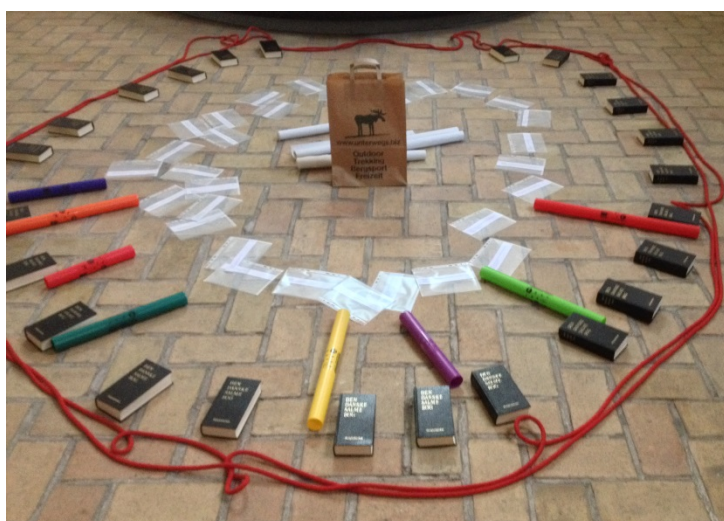
Her et billede fra morgensamlingen fredag.