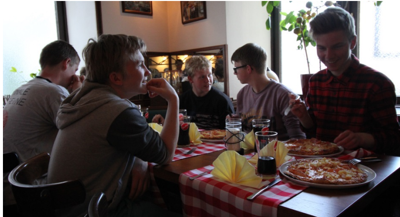
Oppe ved alteret var konfirmanderne af egen drift gået i gang med at øve salmer med grænsegænger-orglet.