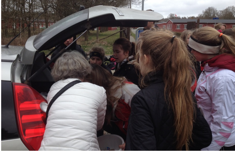
Frokost fra bagsmækken af bilen.

hverken blev købt eller tilberedt for meget eller for lidt. Og godt smagte det!