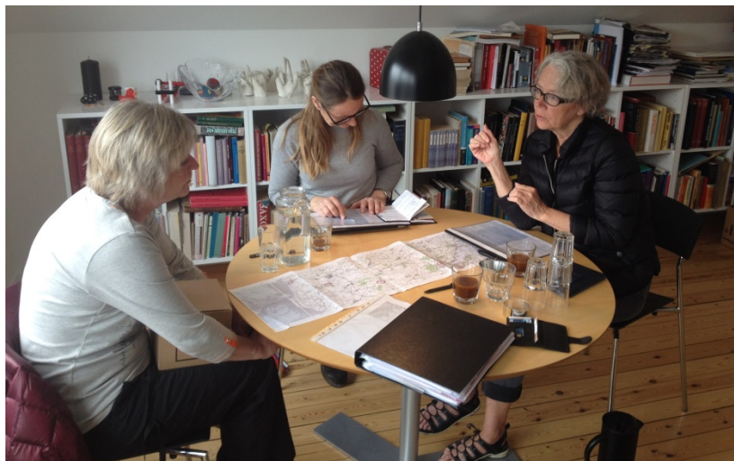
Tanterne til et tantemøde på mit kontor

Jeg holdt naturligvis møder med tanterne forud for turen. Vi gennemgik ruten og jeg havde lavet et skema over turen – sådan hvor vi skulle gå fra og til – og hvor vi skulle sove og kontaktoplysninger til de pågældende steder, og så havde jeg ellers levnet store tomme felter med plads til at skrive noget om, hvad vi skulle spise. Det blev drøftet – men det blev deres beslutninger og valg – og det var dem, der købte ind og forberedte alle de ting. En ubeskrivelig stor hjælp.