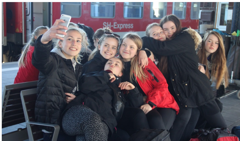
Typisk dog pigerne, som slog billeder op på Facebook

Men - takket være vores facebookgruppe, blev det også en konstruktiv medspiller undervejs – for deres egne løbende opdateringer af billeder var med til at skabe en fælles fortælling, som blev formidlet videre ud og hjem – med f.eks. YouTube-optagelser af Grænsegænger-orgelspillet i gymnastiksalen denne dag, eller som her på billedet med en gruppe-selfie på stationen i Flensborg.