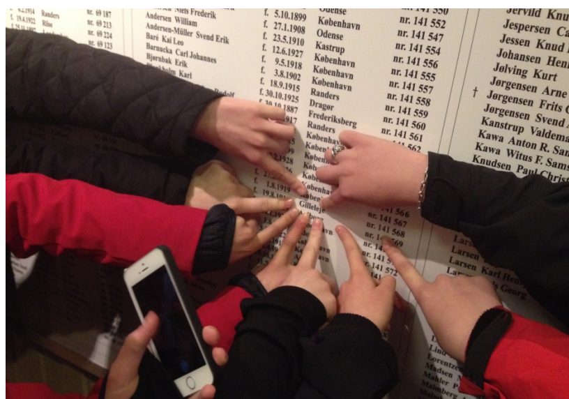
-og bemærk lige, at de også selv fotograferer det.

Foredrag ved lokal sagkyndig om Frøslevlejren som fangelejr under 2. verdenskrig. Foredraget var bestilt på forhånd. Bagefter fik de tid og lejlighed til selv at gå rundt på museets udstilling. Jeg gik med og blev ofte hentet hen for at se, hvad de havde opdaget. Som f.eks. et navn på en fra Gilleleje på listen over de fanger, som var blevet sendt videre til KZ-lejr.