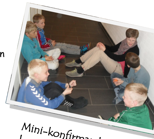
Mini-konfirmander der leger "bønne-leg"