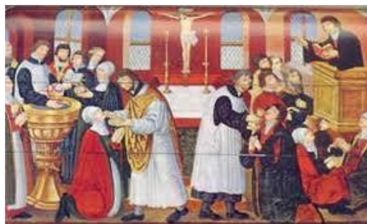
Alter fra Torslunde Kirke. Nu på Nationalmuseet.

Man overværer ikke en gudstjeneste på samme måde, som man som tilskuer overværer et teaterstykke, men man deltager aktivt i gudstjenestens forskellige led ved at syngesalmer som svar på det, præsten læser. Når der læses fra Bibelen, eller når præsten siger enten den apostolske eller den aronitiske velsignelse, rejser man sig op i respekt for det, man hører, ganske på samme måde som det er naturligt at rejse sig op, når et andet menneske taler til én.