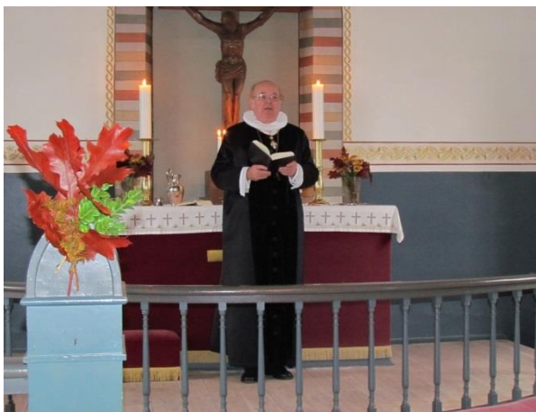
Gudstjeneste i Bågø Kirke i Fyens Stift, Alle Helgens Dag 2011

Meningen med at have en kirke er den, at der skal være gudstjeneste i den. De fleste kirker egner sig ikke til ret meget andet end gudstjeneste. De er gode at synge i, fordi der er efterklang (ekko) i rummet, men de er af samme grund ikke velegnede til jazzmusik eller rockmusik, fordi lyden er for voldsom og derfor "rumler" i kirkerummet.